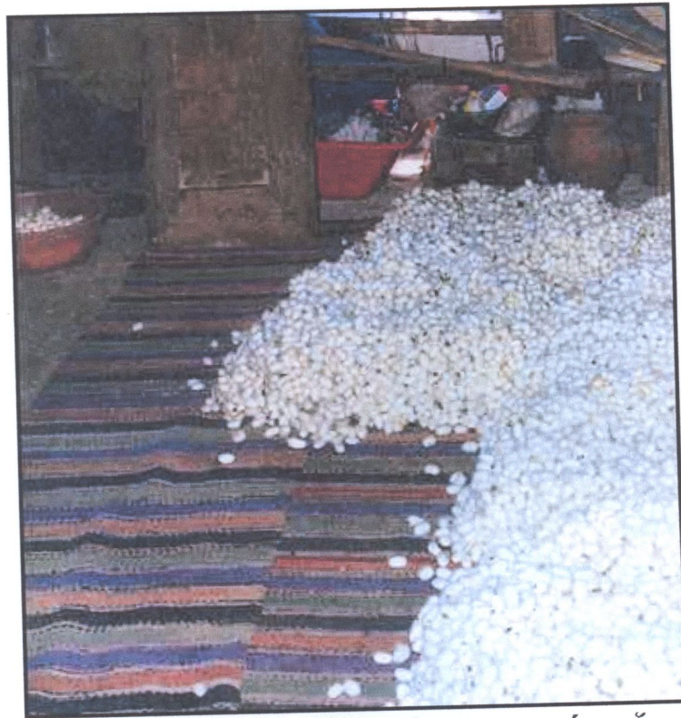
Κουκούλια συγκεντρωμένα για απόπνιξη

Μέσα σε 10 ημέρες από το ξεκλάδωμα πρέπει να γίνει η απόπνιξη ή το ψήσιμο των κουκουλιών για να θανατωθεί η χρυσαλλίδα που βρίσκεται μέσα σ' αυτά πριν προφτάσει και μεταμορφωθεί σε πεταλούδα.