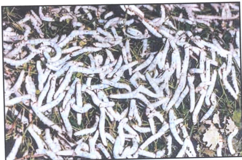
Μεταξοσκώληκες κατά την 4η ηλικία

Έτσι σταματάει να τρώει, βγάζει μερικά μεταξομήματα από το στόμα του με τα οποία στερεώνει τα πόδια του πάνω σε ορισμένα σταθερά σημεία και αφού σηκώσει το κεφάλι προς τα επάνω, μένει στη θέση αυτή ακίνητος επί 1 - 1 1/2 ημέρα περίπου. Το στάδιο αυτό ονομάζεται πρώτος ύπνος.