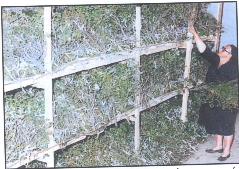
Τοποθέτηση πουρναριού στα κρεβάτια κατά την περίοδο του κλαδώματος

Μόλις ολοκληρωθεί η εκτροφή, οι μεταξοσκώληκες ανεβαίνουν στα κλαδιά πουρναριού που έχουν τοποθετηθεί πάνω στα κρεβάτια για να πλέξουν το κουκούλι τους (τη μεταξένια φούσκα). Ο μεταξοσκώληκας εκκρίνει από τους δύο μεταξογόνους αδένες του το μετάξι και με συγκεκριμένες κινήσεις του σώματός του πλέκει το κουκούλι. Το πλέξιμο γίνεται από έξω προς τα μέσα με αποτέλεσμα ο μεταξοσκώληκας να εγκλωβίζεται μέσα στη φούσκα ενώ σταδιακά μεταμορφώνεται σε χρυσαλίδα. Το πλέξιμο του κουκουλιού ολοκληρώνεται σε 12 μέρες υπό συνθήκες σκότους και απόλυτης ησυχίας. Αμέσως μετά αρχίζει το μάζεμα των κουκουλιών από τα κλαδιά. Το ξεκλάδωμα διαρκεί δύο με τρεις μέρες.