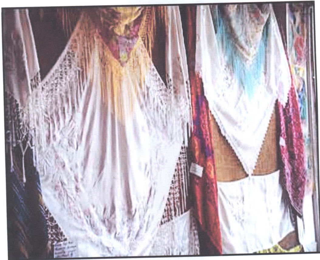
Τα περίφημα μεταξωτά