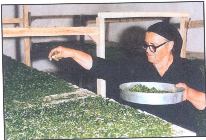
Μεταξοσκώληκες σε νεαρή ηλικία

Κατά την εκτροφή που διαρκεί συνολικά 40 περίπου ημέρες οι μεταξοσκώληκες τοποθετούνται πάνω σε ξύλινα κρεβάτια, τις λεγόμενες κρεβάτες. Κατά την περίοδο της πρώτης ηλικίας, ο μεταξοσκώληκας είναι πολύ μικρός και μαύρος. Τρώει συνεχώς μόνο λεπτοκομμένα μορεόφυλλα και κάθε μέρα μεγαλώνει σημαντικά.